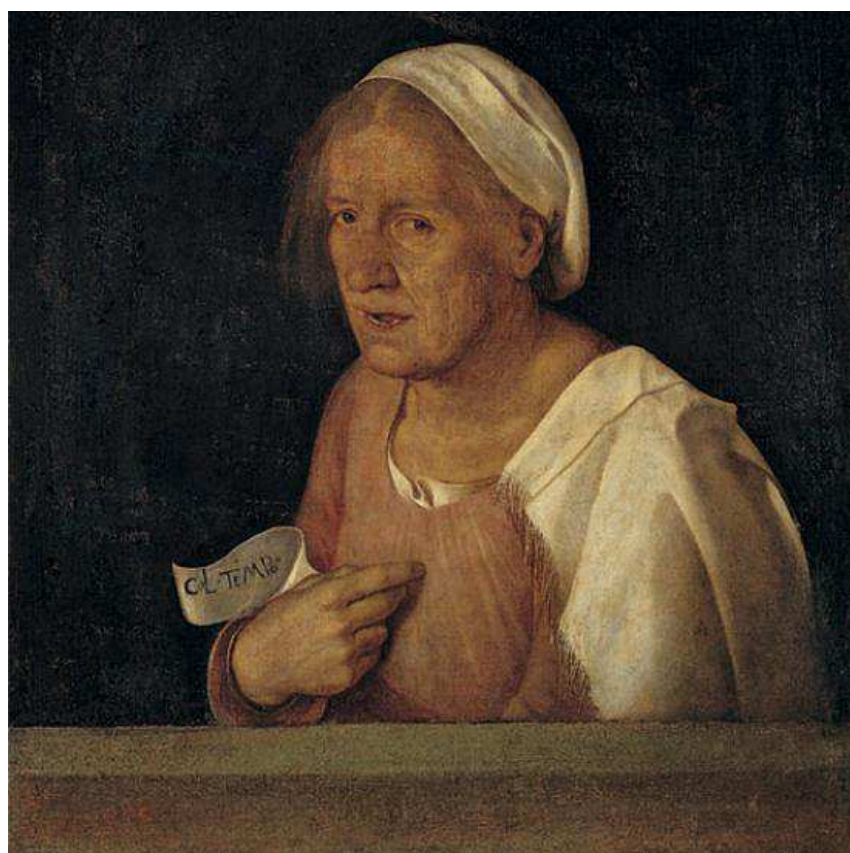
(Zorzi da Castelfranco, detto Il Giorgione)

A cura di: Giovanni Zuliani, Stefania Magon, Margherita Cavalieri